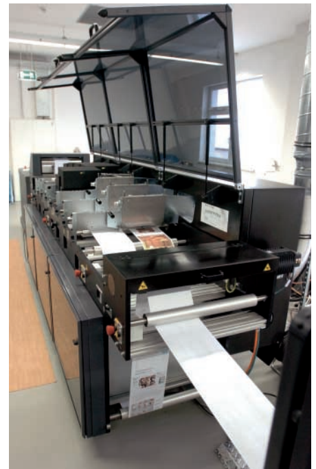
Der Zahlungsträger wird bei DDE-DSE zusammen mit der Rechnung in der Digitaldruckmaschine erzeugt.

auf der alle notwendigen Daten für die Rücksendung enthalten sind.