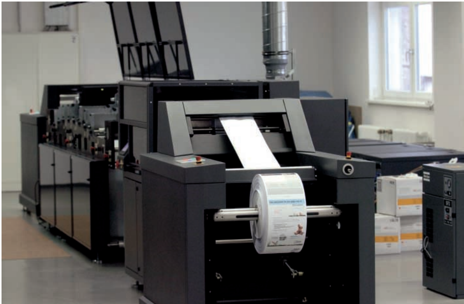
Digitaldruckmaschine Kodak Versamark VT 3000, die mit acht Inkjetdruckköpfen ausgestattet ist. Damit lassen sich in einem Durchgang 4/4-farbige Produkte herstellen – und das in einer Geschwindigkeit von bis zu 2000 DIN-A4-Seiten pro Minute.

Unternehmen mischen, so dass jeder Rechnung zusätzliche Produkte, beispielsweise Flyer, Produktangebote, Werbepriefe et cetera beigelegt werden können, die auf den jeweiligen Endkunden abgestimmt sind. So kann theoretisch jede Sendung völlig unterschiedlich zu der vorhergehenden sein.