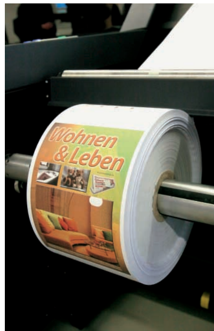
Gedruckt wird von Rolle zu Rolle in einer Druckauflösung von 300 x 600 dpi.

INDIVIDUELLES PRODUKT. Gleichzeitig ermöglicht es die von DDE-DSE entwickelte Software, aus dem Datenstrom der Kunden ein auf den Empfänger vollständig abgestimmtes individuelles Produkt zu erstellen. So kann beispielsweise auf die Rechnung oder den Bescheid an jeder beliebigen Stelle gleichzeitig ein Überweisungsträger bzw. eine Einzugsermächtigung aufgedruckt werden,